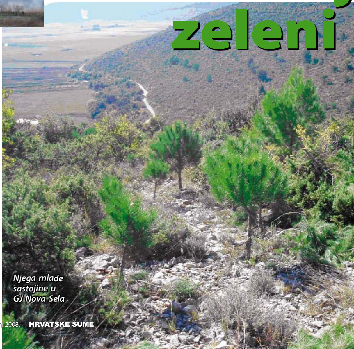
Njega mlade sastojine u GJ Nova Sela