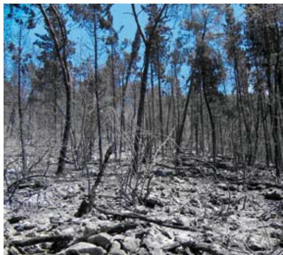
Opožarena površina u GJ Šibovica