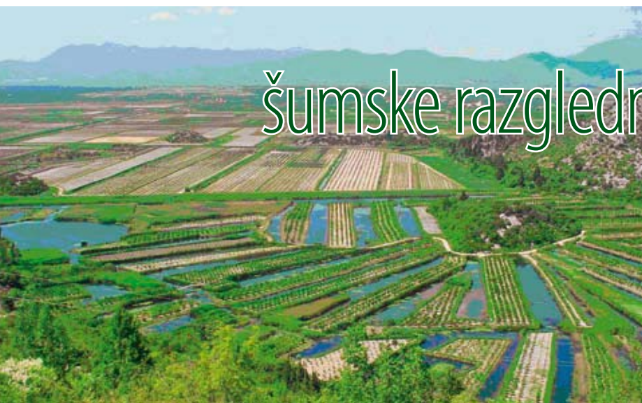
Melioracija u delti Neretve